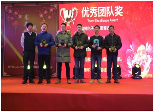
2017 年优秀团队表彰大会