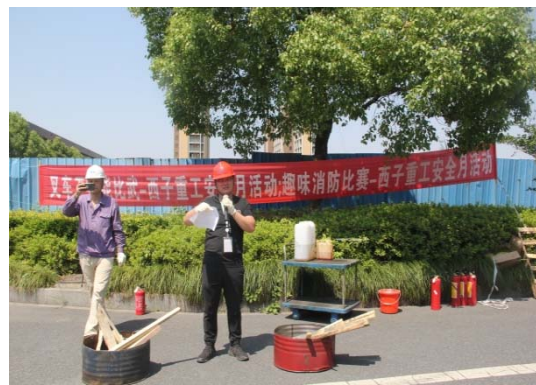
2018 年 6 月 14 安全月活动