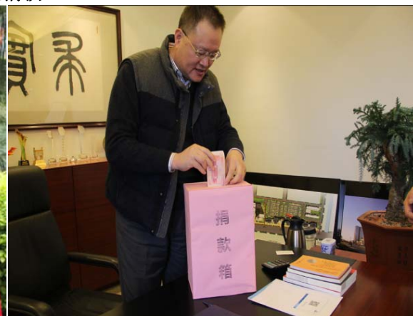
高层领导亲自参与公益事业