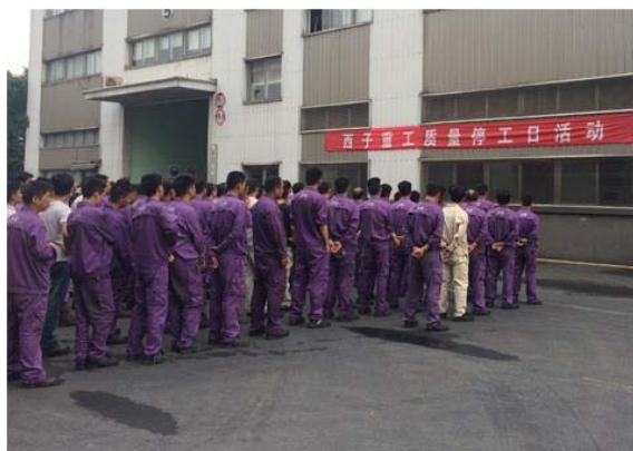
2017 年全体员工品质培训会