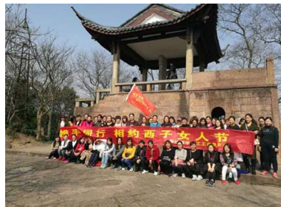
2017 年 3 月 8 日三八节活动