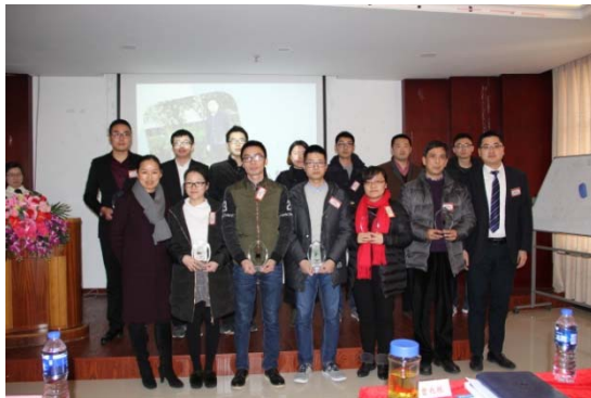
2016 年优秀员工表彰暨誓师大会

公司严格执行《劳动法》及《劳动合同法》相关规定，与员工签订劳动合同，按规定为员工缴纳五险一金，并提供形式多样的培训，包括高校深造、外聘专家讲座、部门内训、外派培训、E-learning 在线视频、参观交流、现场教学、户外拓展和读书自学等，努力将人才培养与企业的发展相适应。在技能技术提升方面，公司开展“师傅带徒”“等级工培养”“职工技术攻关”等工作，搭建技术工人成长平台。此外，公司定期开展员工满意度调查，对员工提出的意见或建议及时整理、分析、并督促相关部门落实改进。